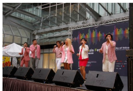
* 8/18 噴水池廣場