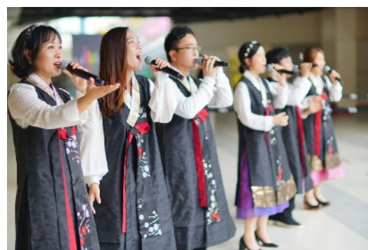
* 8/18 戶外廣場