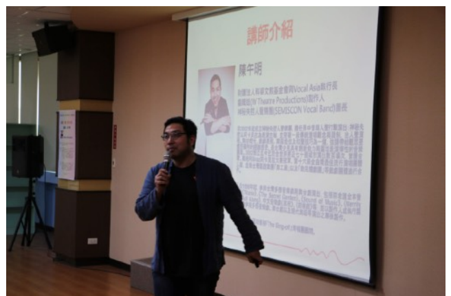
* 10/31 愛上阿卡貝拉@新竹市光復高中