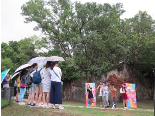
* 7/2 臺南安平樹屋