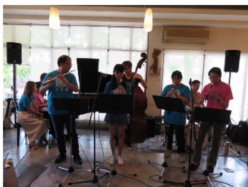
* 成果發表會於璞石咖啡館舉辦