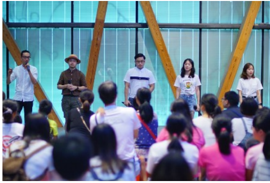
* City Singers