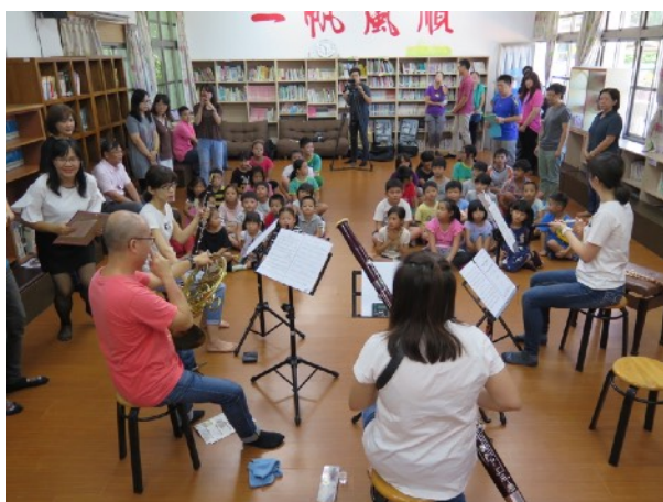
* 9/3 池上鄉大坡國小