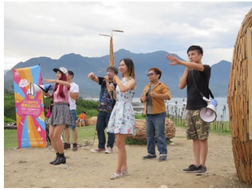
* 7/3 臺東加路蘭海岸