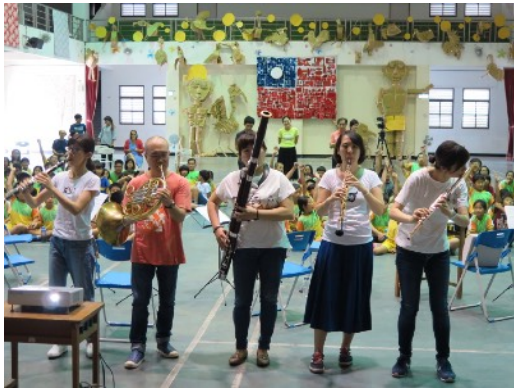
* 9/3 池上鄉福原國小