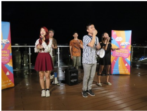
* 7/2 高雄西子灣觀景平臺