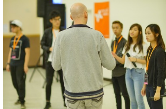
* 8/17 Group Coaching: Groundbreaker