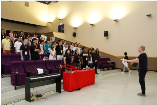
* 8/18 Interpretation of the Songs