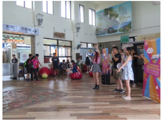
* 7/3 屏東枋寮火車站