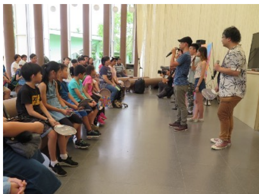
* 7/1 南投埔里紙教堂