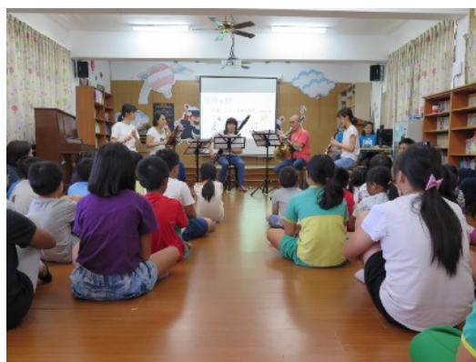
* 9/3 池上鄉大坡國小