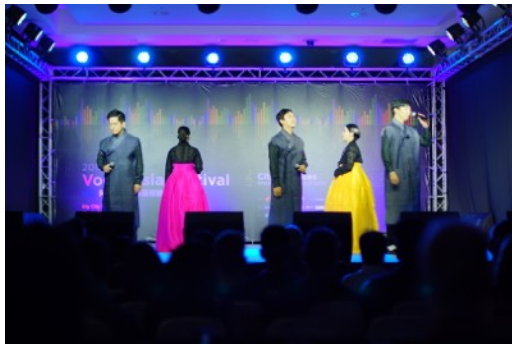
* 比賽團隊：Torys (韓國)