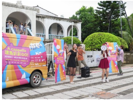
* 7/2 臺南英商德記洋行