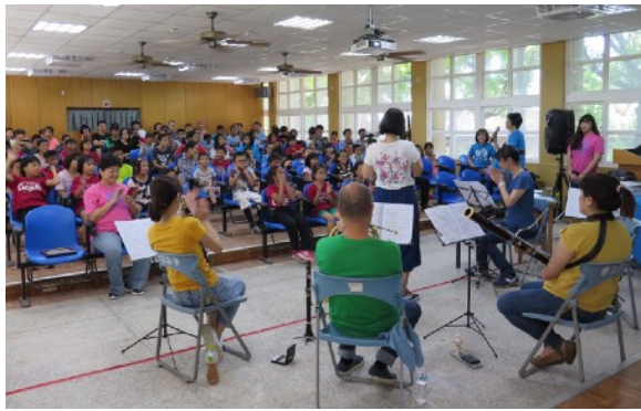
* 9/4 長濱鄉長濱國小