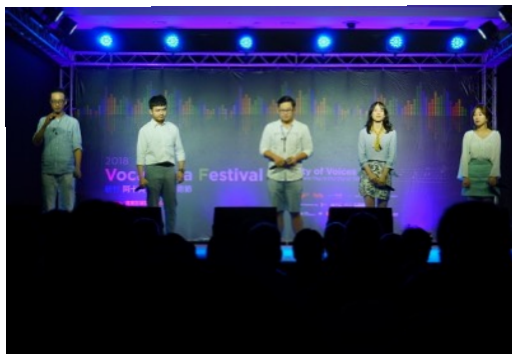
* 比賽團隊：City Singers (中國)