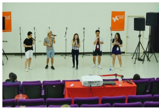
* 8/18 Group Coaching: Boonfaysau