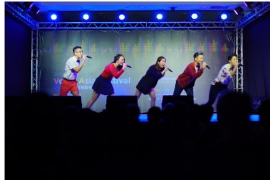
* 比賽團隊：Boonfaysau (香港)