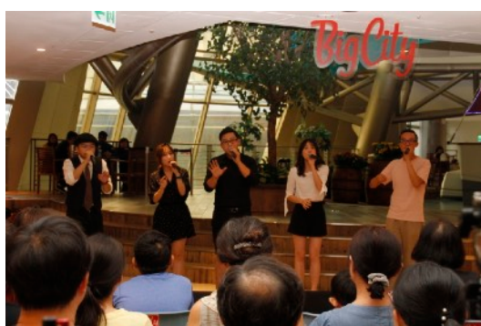
* 8/17 希望永續號廣場