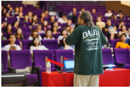
* 8/17 Hakka Traditional and Folk Music