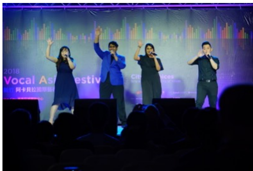
* 比賽團隊：The 4 of Us (馬來西亞)