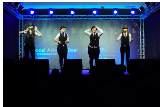
* 比賽團隊：Noire (中國)