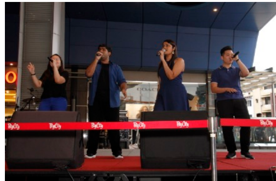
* The 4 of Us