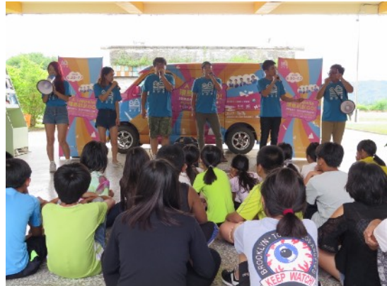
* 7/4 花蓮玉里春日國小