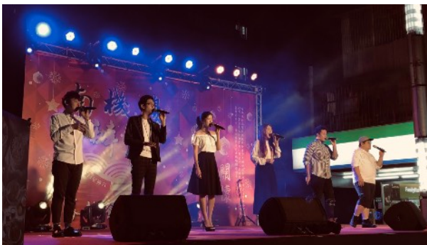
* 餐會演出—Voco Novo 爵諾歌手