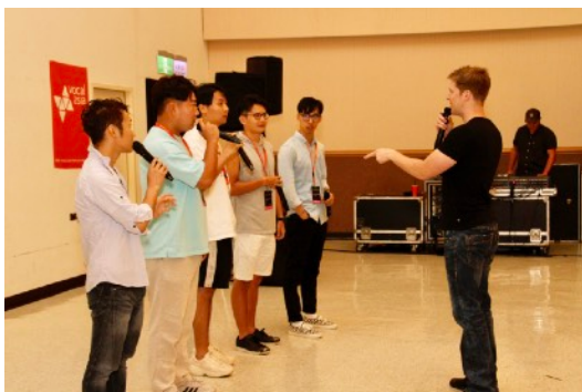
* 8/18 Beatbox