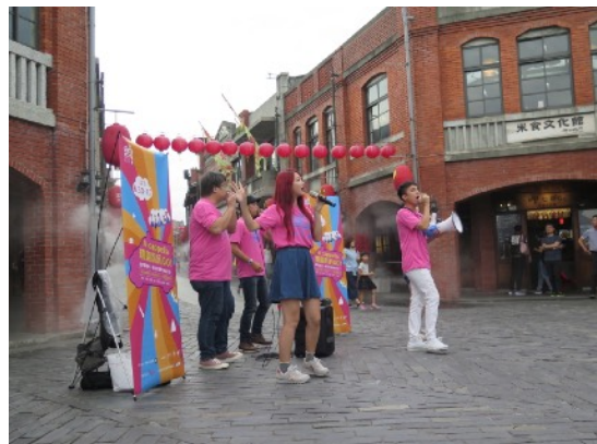
* 7/5 宜蘭國立傳統藝術中心