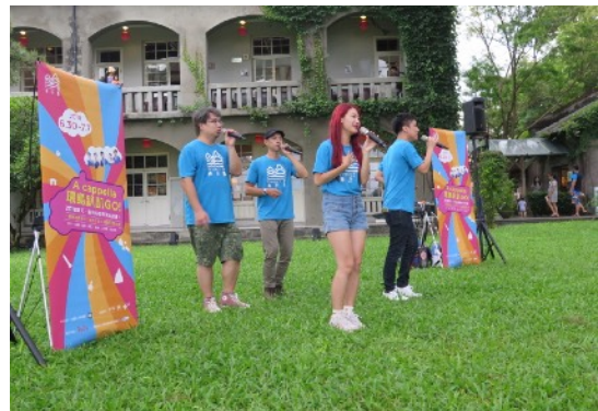
* 7/4 花蓮松園別館