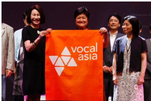
* 2018 交接儀式