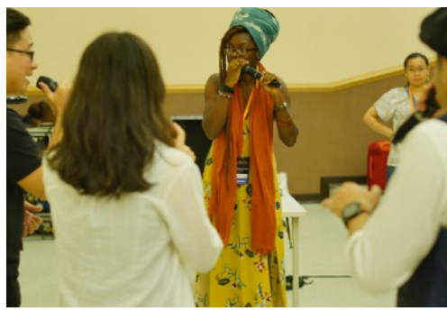
* 8/17 Group Coaching: City Singers