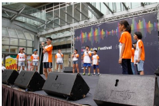
* 8/17 噴水池廣場