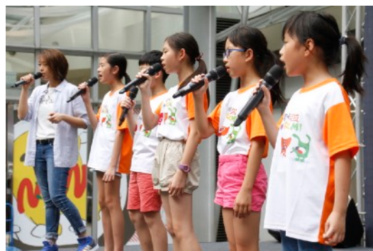
* 8/17 噴水池廣場