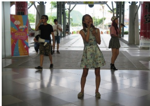
* 7/3 臺東火車站