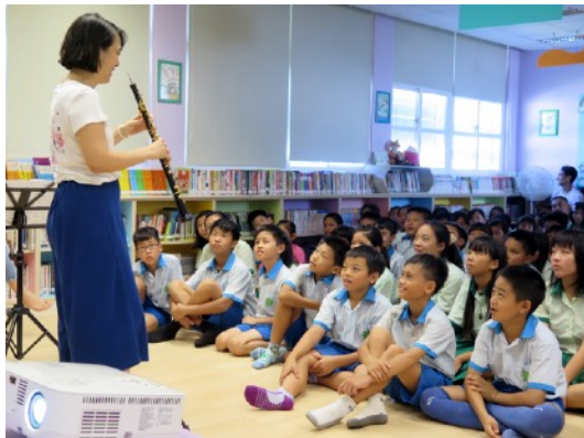
* 9/4 成功鎮成功國小