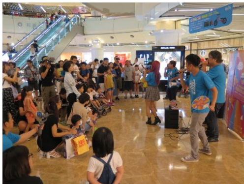
* 7/7 新竹巨城室內場