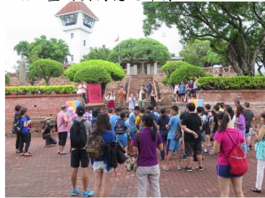
* 7/2 臺南安平古堡