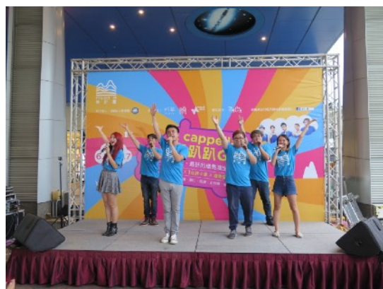
* 7/7 新竹巨城戶外場