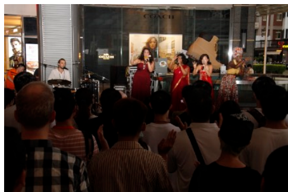
* The Women of the World