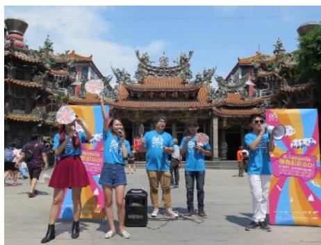
* 6/30 臺中大甲鎮瀾宮