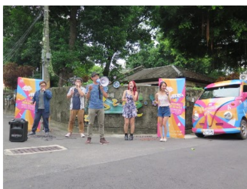
* 7/1 臺南321藝術聚落