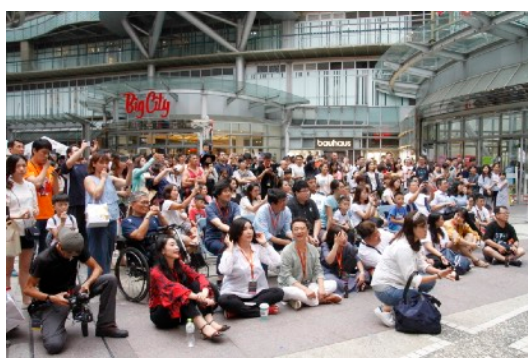
* 8/18 噴水池廣場