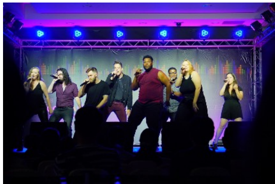
* 演出嘉賓：Impromptu (美國)