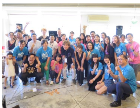
* 講師們與學員大合照