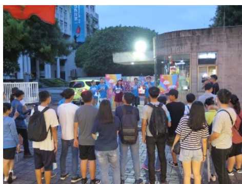
* 6/30 臺中逢甲夜市