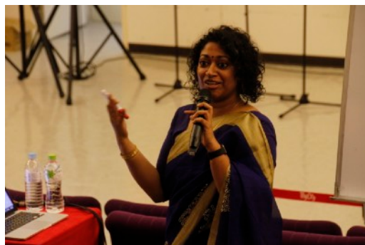
* 8/17 Music and Leadership