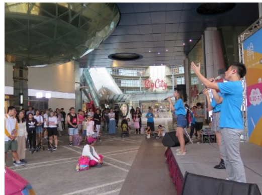
* 7/7 新竹巨城室內場