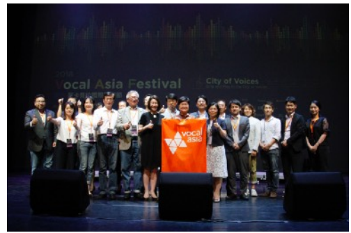
* 2018 交接大合照