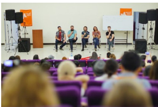
* 8/19 Meet and Sing with Home Free