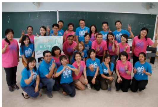
* 講師與學員大合照