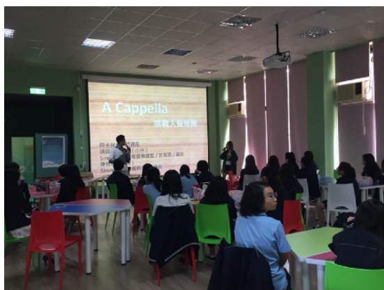
* 10/24 阿卡貝拉入門講座@新竹高商