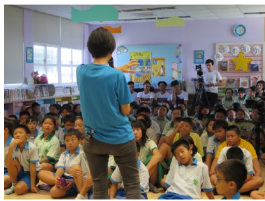
* 9/4 成功鎮成功國小