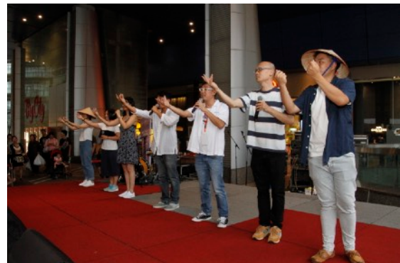
* Gay Singers