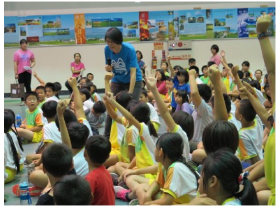
* 9/3 池上鄉福原國小