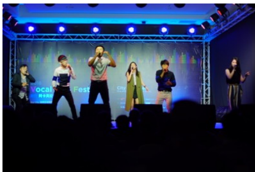
* 比賽團隊：MuseMic Vocal Band (臺灣)