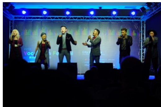
* 比賽團隊：Pinopela (菲律賓)