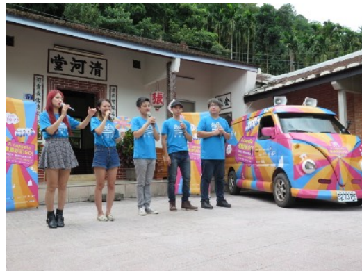
* 7/7 新竹清河堂古厝