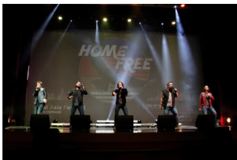
* Home Free