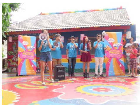
* 6/30 臺中彩虹眷村