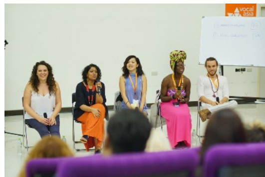
* 8/18 Meet and Sing with Women of the World