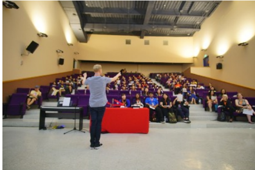
* 8/17 How to Rehearse