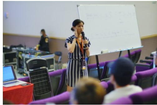
* 8/17 Arranging Master Class