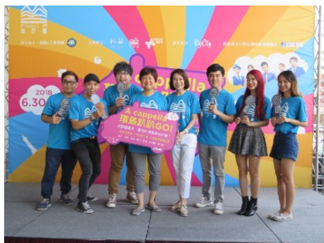
* 6/30 新竹巨城啟程