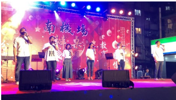
* 餐會演出—神秘失控人聲樂團