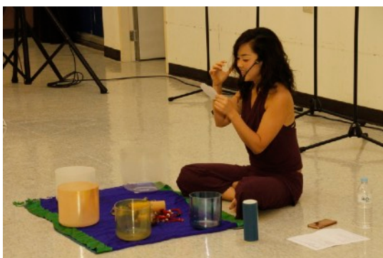
* 8/19 Mindful Singing Meditation