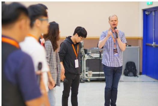
* 8/17 Group Coaching: MuseMic Vocal Band