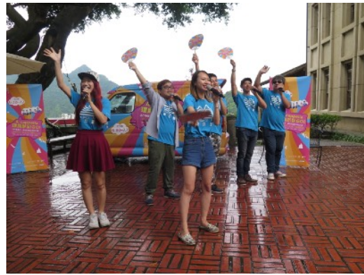
* 7/6 新北市立黃金博物館