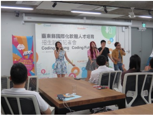
* 7/3 臺東TTMaker文創園區