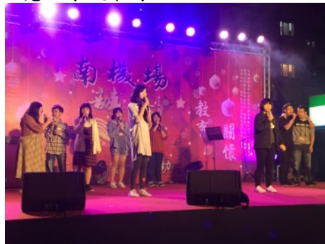
* 餐會演出—魔豆學院