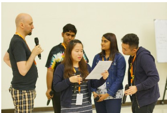
* 8/18 Group Coaching: The 4 of Us