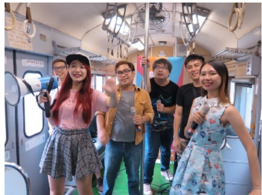
* 7/3 臺鐵藍皮普快-3671車次