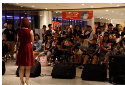
* 8/17 希望永續號廣場