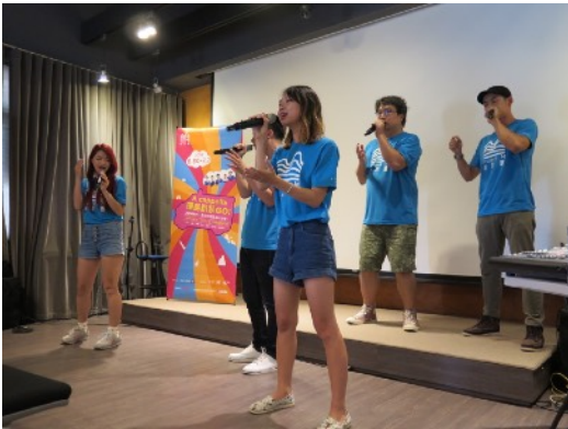
* 7/4 臺東大坡池音樂館