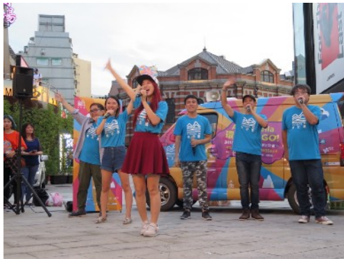
* 7/6 臺北市西門町紅樓廣場