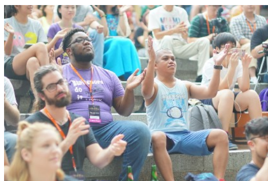
* 8/18 戶外廣場