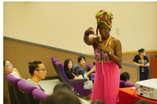
* 8/18 Sing Your Heart