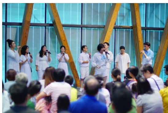
* Song Forest