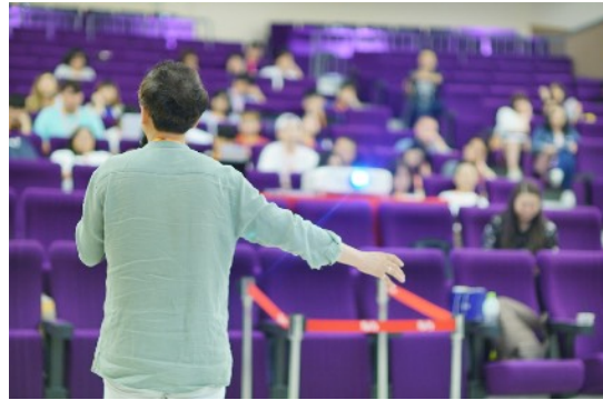
* 8/18 A Cappella Education Method