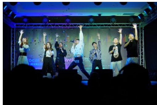
* 比賽團隊：Freewill Vocal Band (中國)