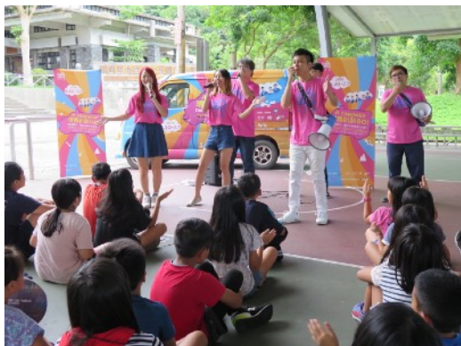
* 7/5 宜蘭南澳金岳國小