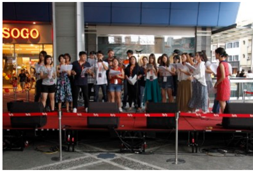
* Single Singers