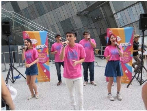
* 7/5 宜蘭蘭陽博物館