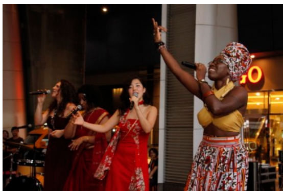
* The Women of the World