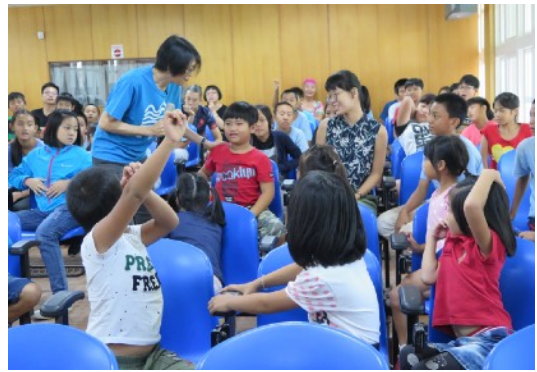
* 9/4 長濱鄉長濱國小