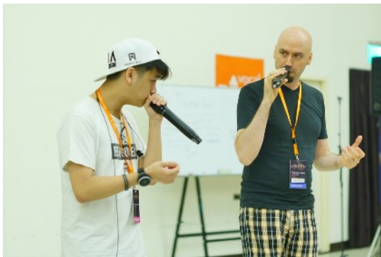
* 8/18 Rhythmic Awareness