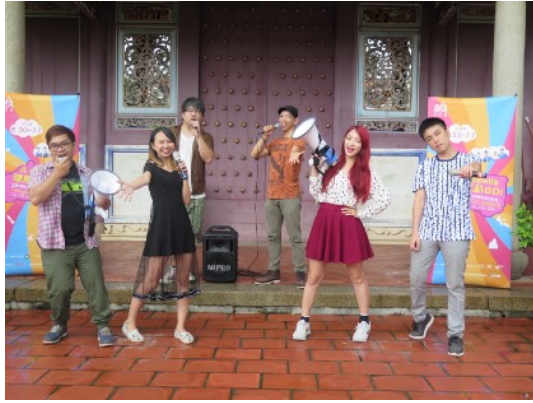
* 7/2 臺南孔廟