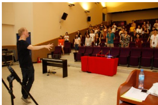
* 8/17 Open Your Ears and Senses